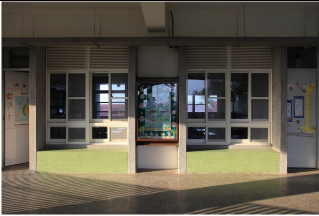
校舍建築採雙面走廊，大窗戶及落地窗透明玻璃設計；採光良好。