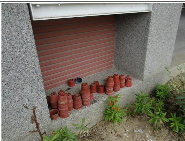
利用課後棄置不用之花盆，加以利用成為雨水接收器，吊掛於樹枝並配合於樹幹四周挖掘內傾之淺坑，減緩雨水逕流至地表之速度，增加雨水再利用之效率。