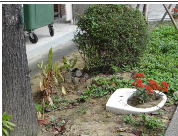
利用舊校舍拆除之廢棄馬桶、水箱及洗臉盆，加以利用成為植栽之花器。