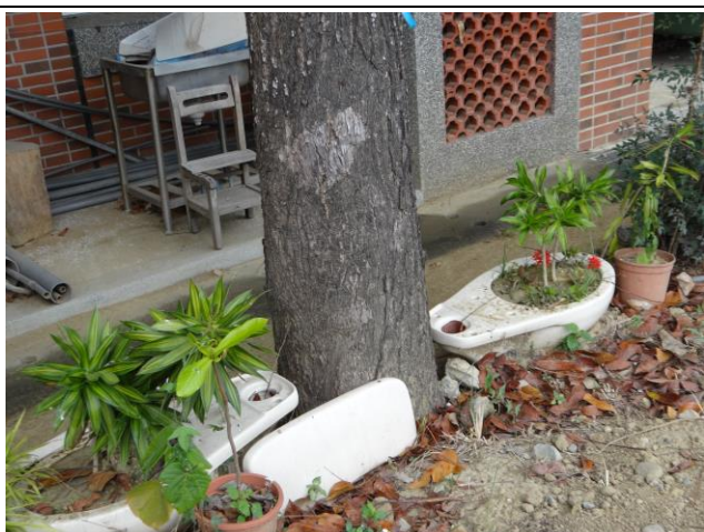
利用舊校舍拆除之廢棄馬桶、水箱及洗臉盆，加以利用成為植栽之花器。