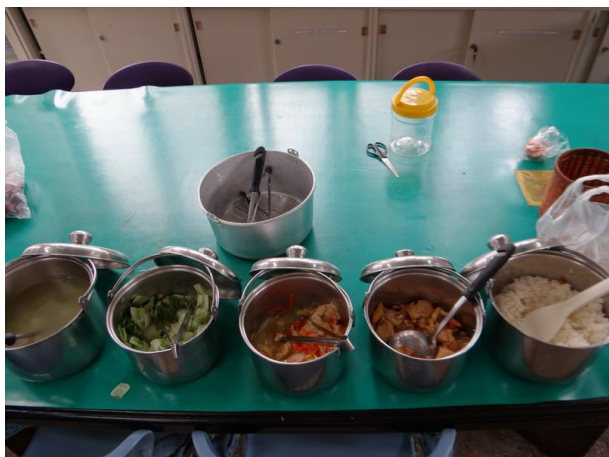
教師用餐區~全年蔬食供餐