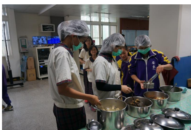
學生全年蔬食用餐-打菜區