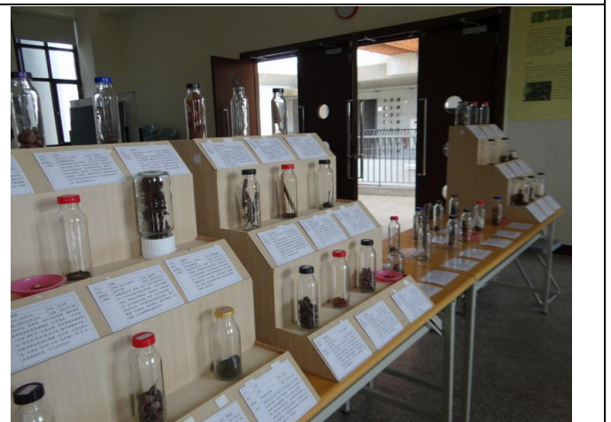
結合校外資源辦理環境教育相關展覽 ~種子展