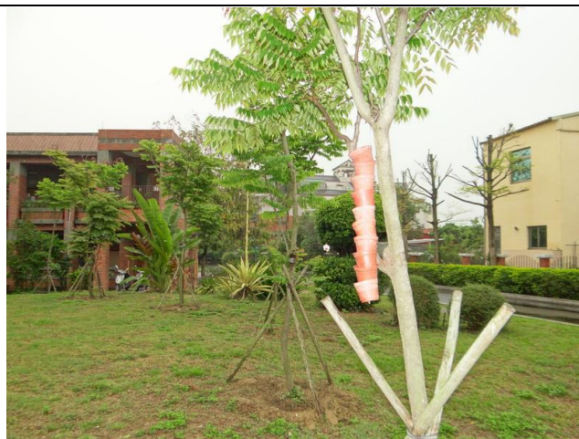
利用課後棄置不用之花盆，加以利用成為雨水接收器，吊掛於樹枝並配合於樹幹四周挖掘內傾之淺坑，減緩雨水逕流至地表之速度，增加雨水再利用之效率。