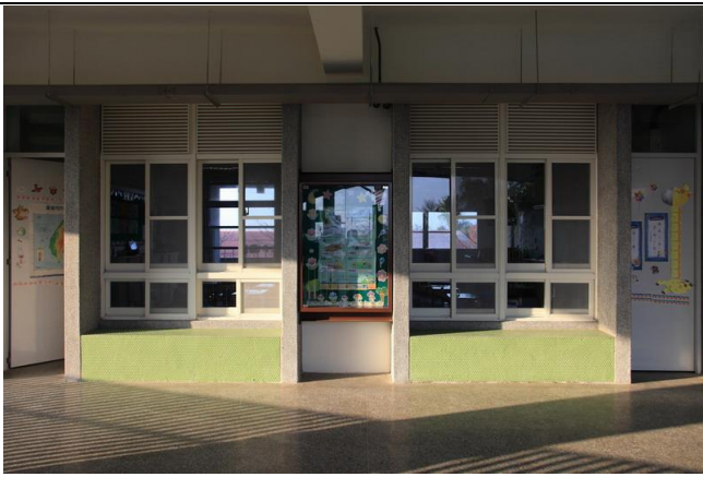
校舍建築採雙面走廊，大窗戶及落地窗透明玻璃設計；採光良好。