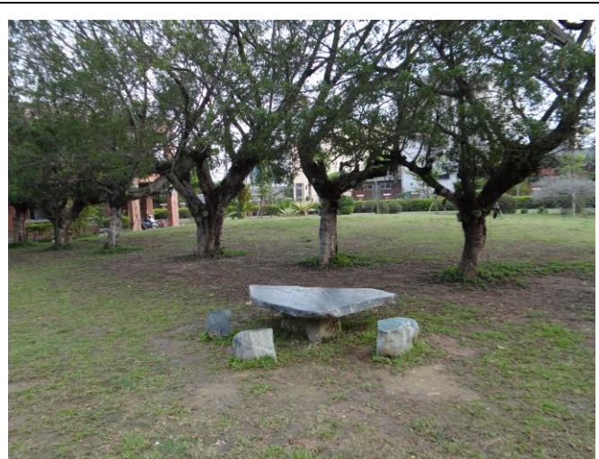
廣場及校園內休憩椅設置，採用健康自然素材。