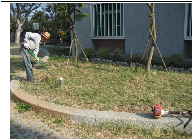
校園內花圃或空地利用人工方式鬆土，混合有機肥，進行土壤改良及種植植物，效果漸顯著。