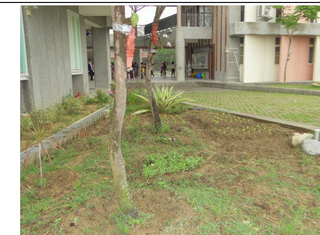
校園內花圃或空地利用人工方式鬆土，混合有機肥，進行土壤改良及種植植物，效果漸顯著。