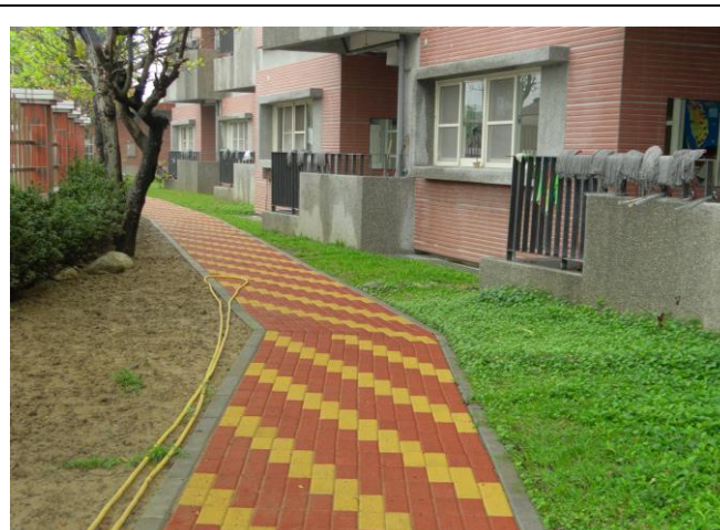
校園內花圃或空地利用人工方式鬆土，混合有機肥，進行土壤改良及種植植物，效果漸顯著。