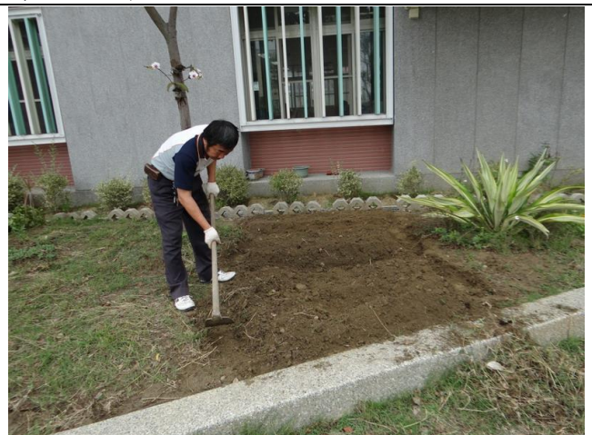
校園內花圃或空地利用人工方式鬆土，混合有機肥，進行土壤改良及種植植物，效果漸顯著。