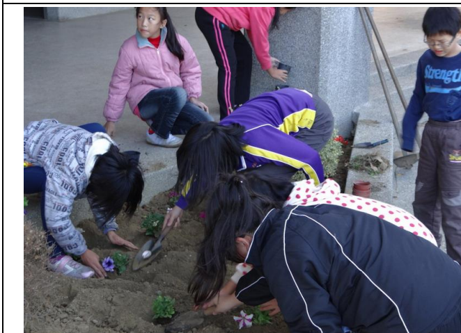
校園內花圃或空地利用人工方式鬆土，混合有機肥，進行土壤改良及種植植物，效果漸顯著。