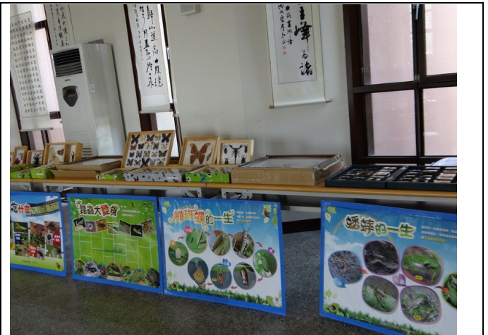
結合校外資源辦理環境教育相關展覽 ~昆蟲展