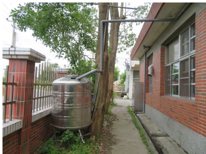
利用廢棄之水塔搭設雨水回收系統~用於 校園植栽及草皮之澆灌