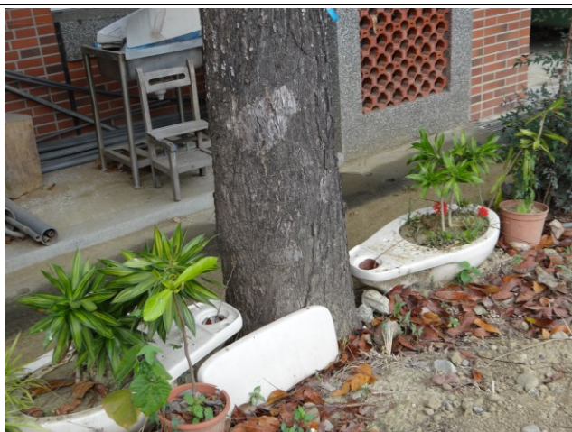
利用舊校舍拆除之廢棄馬桶、水箱及洗臉 盆，加以利用成為植栽之花器。