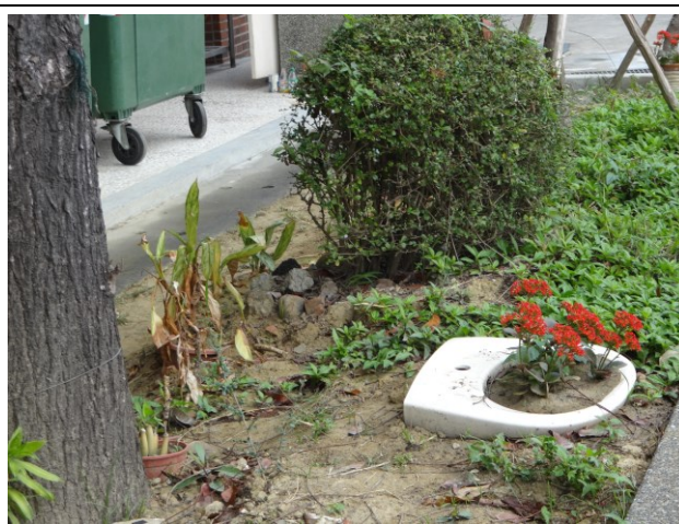
利用舊校舍拆除之廢棄馬桶、水箱及洗臉 盆，加以利用成為植栽之花器。