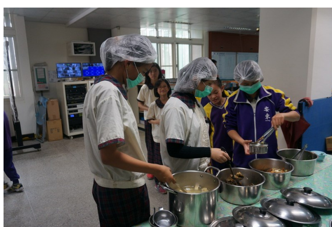
學生全年蔬食用餐-打菜區