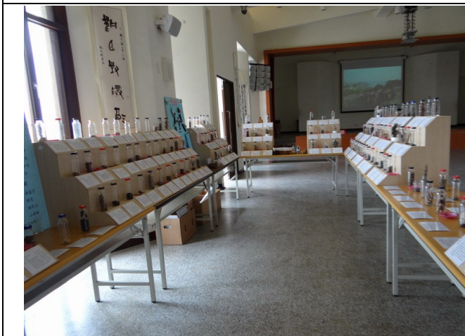
結合校外資源辦理環境教育相關展覽 ~種子展