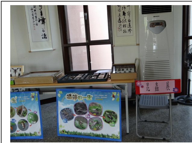
結合校外資源辦理環境教育相關展覽 ~昆蟲展