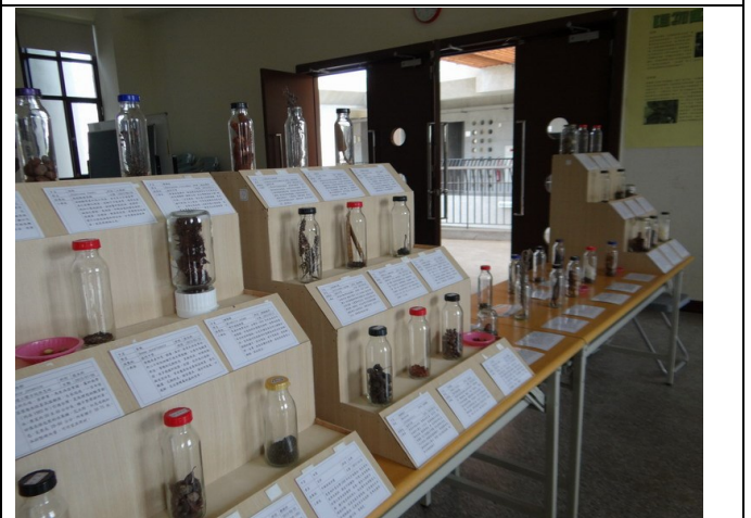
結合校外資源辦理環境教育相關展覽 ~種子展