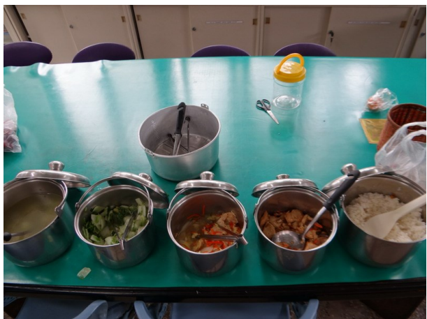
教師用餐區~全年蔬食供餐