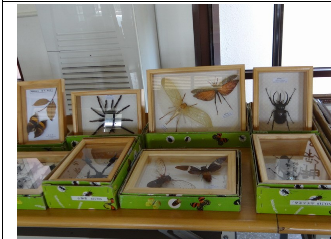
結合校外資源辦理環境教育相關展覽 ~昆蟲展