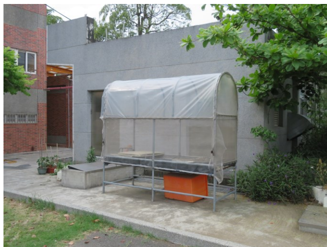
配合社區大學推廣課程，進行水耕蔬菜栽 種之教學