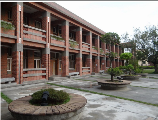
廣場及校園內休憩椅設置，採用健康自然素材。