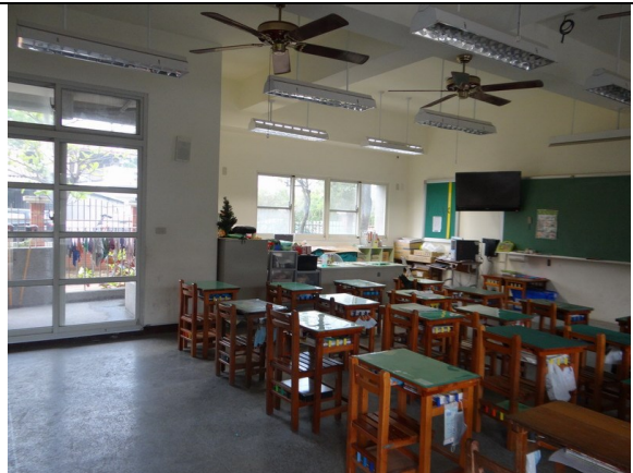
校舍建築採雙面走廊，大窗戶及落地窗透明玻璃設計；採光良好。