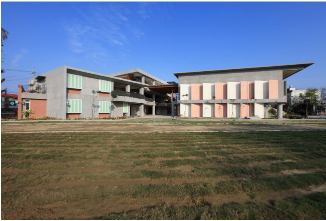
西向行政與多功能室利用出簷及外牆遮陽板的造型，減少日曬。