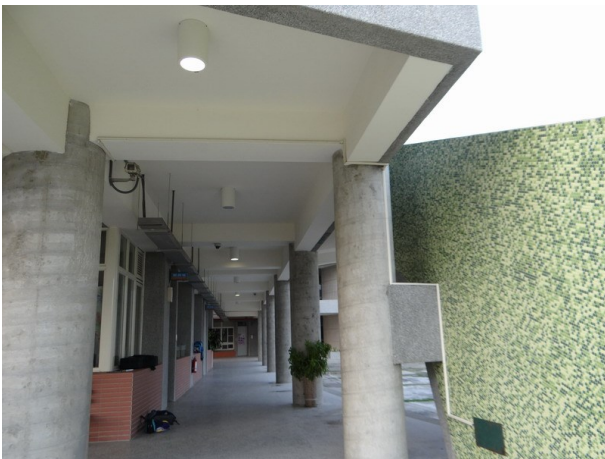
走廊燈光採間隔式設計，可因應需求而開關節約能源。