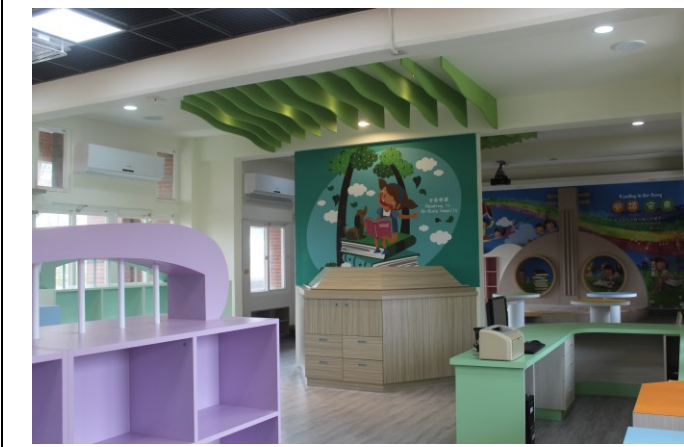
圖書室裝修工程~室內裝修採健康建材與自然素材