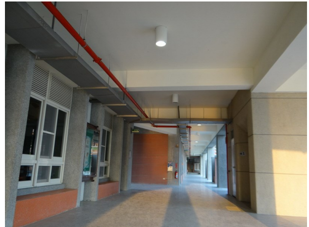
走廊燈光採間隔式設計，可因應需求而開關節約能源。