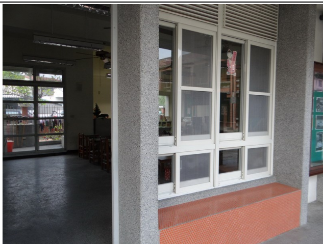
校舍建築採雙面走廊，大窗戶及落地窗透明玻璃設計；採光良好。