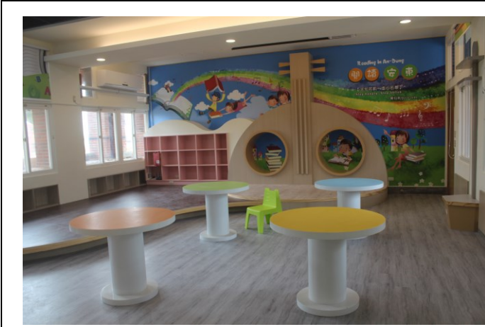
圖書室裝修工程~室內裝修採健康建材與自然素材