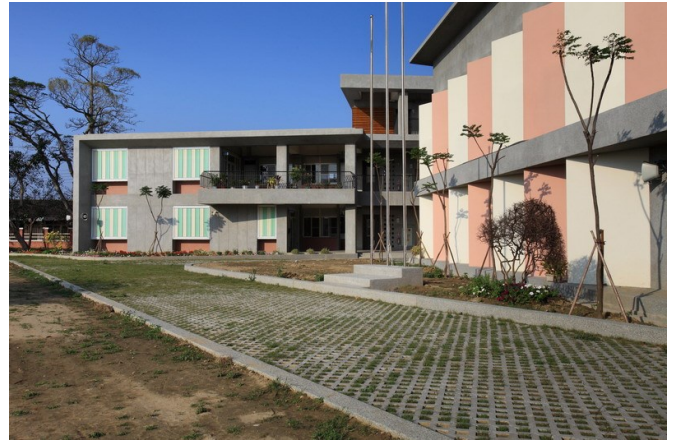
西向行政與多功能室利用出簷及外牆遮陽板的造型，減少日曬。