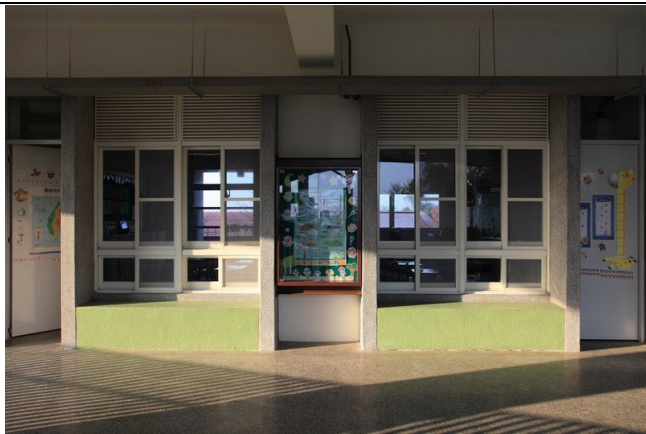
校舍建築採雙面走廊，大窗戶及落地窗透明玻璃設計；採光良好。