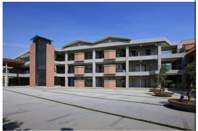
教室配置為座北朝南，走廊配置於南側，抵禦寒冷的北風。