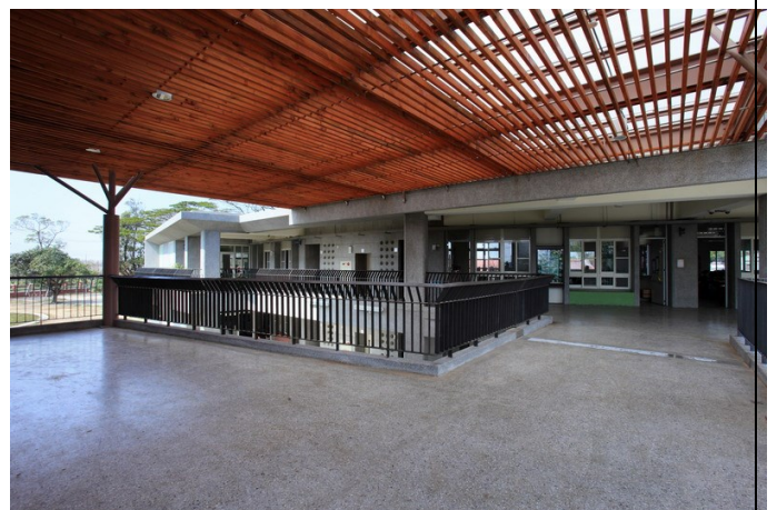
建築量體利用局部透空導入涼爽的西南風散熱。