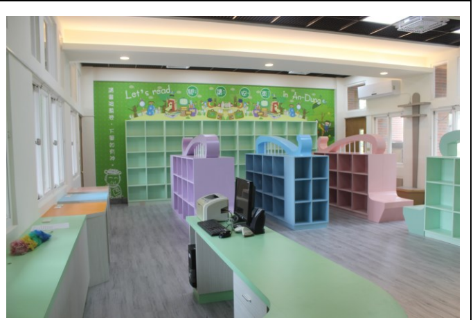
圖書室裝修工程~室內裝修採健康建材與自然素材