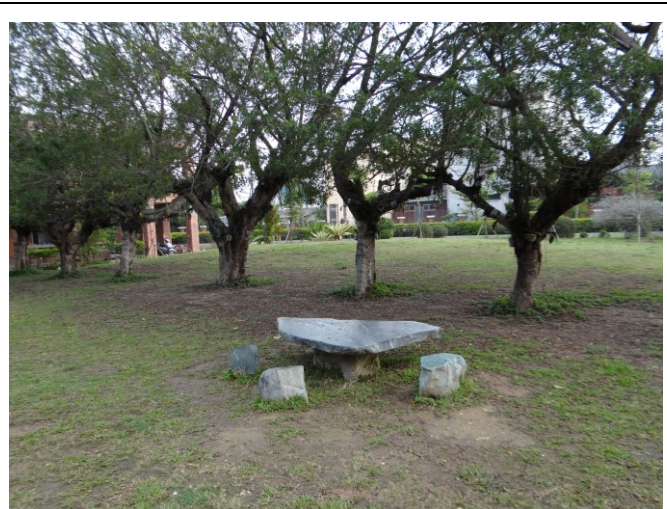
廣場及校園內休憩椅設置，採用健康自然素材。